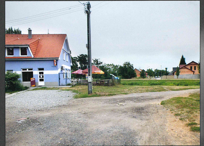
Do roku 1927 byla jatka v těchto místech, na břehu ramena řeky Moravy