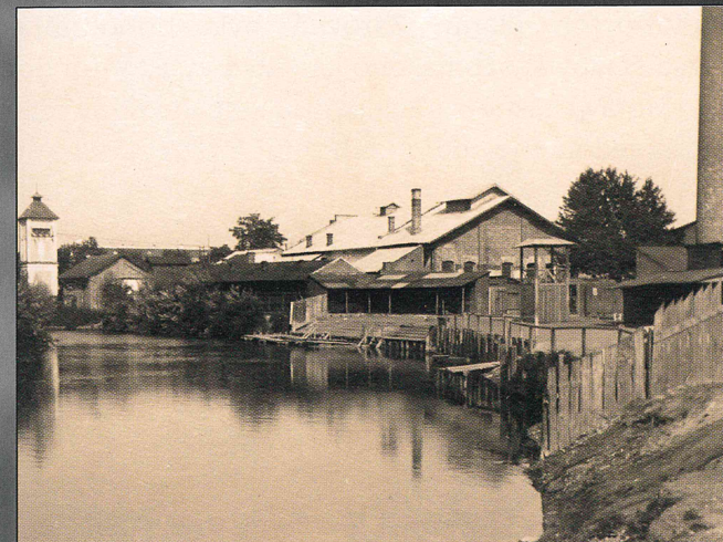
Zadní strana areálu jatek pohledem od řeky