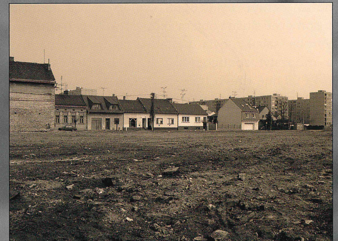
Konec ulice Legionářů po asanaci v roce 2002