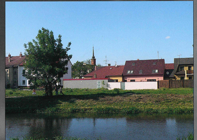
Dnes se na místě bývalých jatek staví rodinné domky