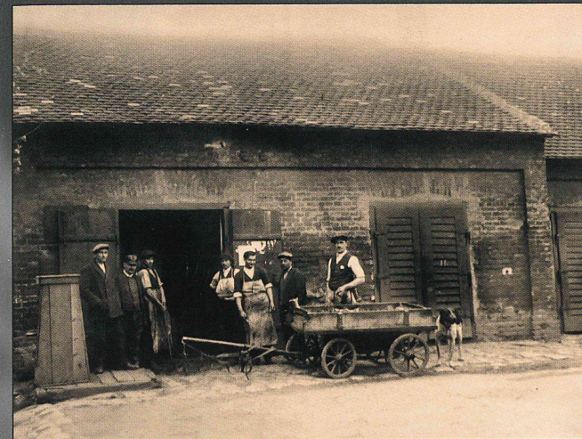
Šlachta neboli bituňk na konci ulice Radniční v roce 1922

V sedmdesátých letech se započalo za městem s výstavbou nového Masokombinátu a budovy bývalých jatek u ulice Legionářů řezníci opustili. Areál sloužil různým účelům, až v roce 2002 byla v těchto místech provedena kompletní demolice. Pozemky byly asanovány a dnes je už v této části města postaveno několik rodinných domů. Téměř stejně dopadl i Masokombinát, asanován sice není, ale k původnímu účelu už řadu let také neslouží.